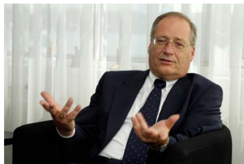
Burgemeester Wim Deetman (foto): "Bij de controles die al een paar jaar plaatsvinden is geen verbetering merkbaar"

Uit een controle van de Haagse horeca, door politie en brandweer, blijkt dat het in bijna tweederde van de bedrijven schort aan de brandveiligheid. De meeste horecaondernemers gingen in de fout met verkeerde of niet bestaande vluchtwegen. Maar ook kleine overtredingen als geen deksel op een frituurpan en te veel mensen in de zaak komen regelmatig voor.